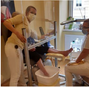
Abstand halten bei der Fußpflege