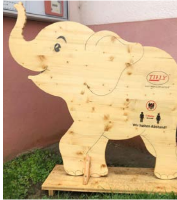
Elefant in einem Sägewerk und Holzgroßhandel