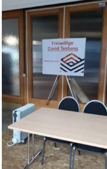
Vor allem größere Betriebe setzen auf Covid Testungen, ihrer Arbeitnehmerinnen und Arbeitnehmer, direkt vor Ort. In der Regel durch externe Dienstleisterinnen und Dienstleister.