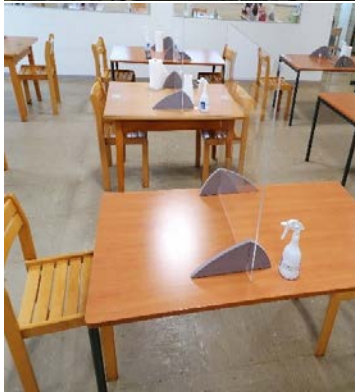
Sozialbereich mit , durch Plexiglas, getrennten Sitzbereichen