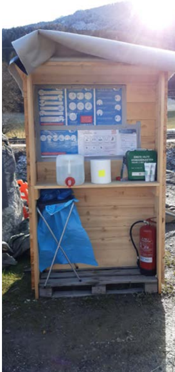
Hygienestützpunkt auf einer Baustelle