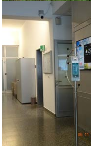
Kamera zum Fieber messen über dem Durchgang und einer Anzeige direkt am Monitor. Davor ein Desinfektionsspender.