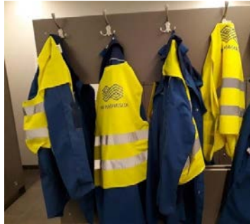
Desinfizierte Kleidung für Externe, in einem Produktionsbetrieb