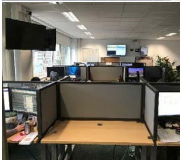
Abstandsregelung in einem Callcenter