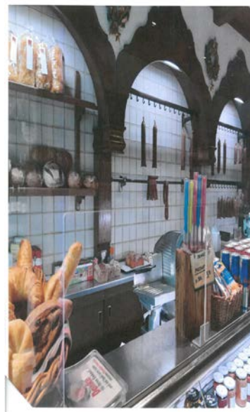
Bauliche Abtrennung in einem Fleischwarenverkauf