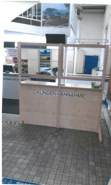
Versetzte Kundenannahme um den Abstand zu den Mitarbeiterinnen und Mitarbeitern gewährleisten zu können.