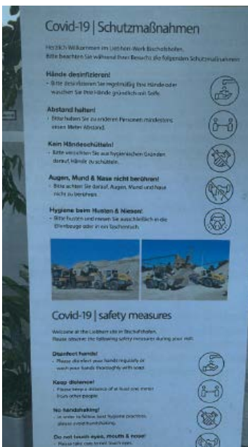
Covid-19 Schutzmaßnahmen, aufgestellt an zentralen Punkten im Betrieb