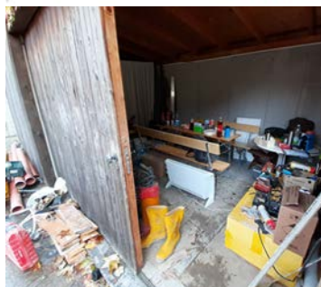
Auf „Kleinbaustellen“ ist die Bewusstseinsbildung schwer. Dazu ein Negativbeispiel eines Aufenthaltsbereiches.