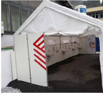
Hygieneschleuse zu einem Bergbaubetrieb