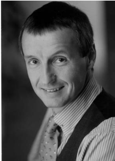
Dr. Martin Bartenstein Bundesminister für Wirtschaft und Arbeit

Als Schlüsselfaktoren für den Standort Österreich sind Arbeit und Wirtschaft heute längst nicht mehr zwingende Gegensätze. Im Gegenteil: Es braucht der beschleunigte Wandel der Arbeitswelt in globalisierten Märkten eine konzertierte und schnelle Entscheidungsfindung auf allen Ebenen.