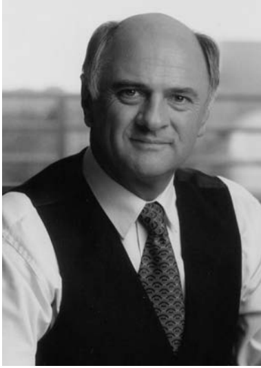
Dr. Erwin Pröll Landeshauptmann von Niederösterreich

Österreichs EU-Beitritt und die Globalisierung der Wirtschaft haben auch den österreichischen Arbeitsmarkt nachhaltig verändert. Durch die Hightech-Betriebe sind neue Berufsbilder entstanden und neue Anforderungen für die Arbeitnehmer. Durch längere und andere Öffnungszeiten der Geschäfte sind die Arbeitszeiten flexibler geworden, die Bestimmungen für die Nachtarbeit - vor allem für die Frauen - haben sich verändert.