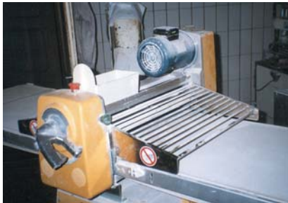
schlecht - die Motorabluft wird direkt über den Mehlbehälter geführt