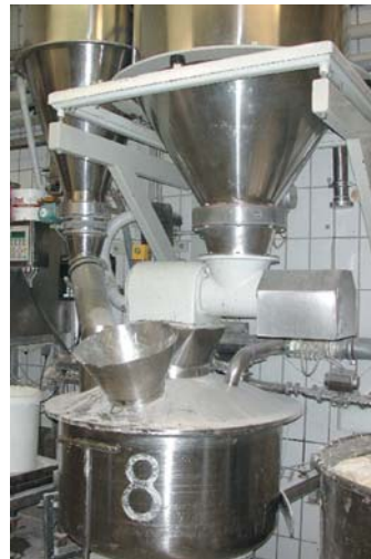
geschlossene Mehlausbringung mit Deckel und Absaugung

Die Transportluft der Mehlsiloanlage darf nicht über den im Arbeitsraum situierten Zyklon in den Arbeitsraum abgegeben werden.