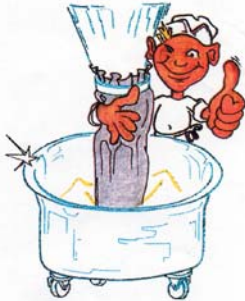
langer Einfüllschlauch ✓

Ausreichend langer Stoffschlauch oder Gewebeschlauch bei der Mehlausbringung und Instandhaltung derselben.