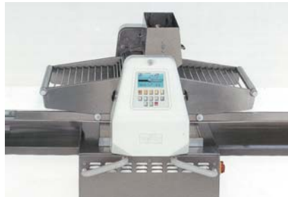
gut - automatische Bestäubung reduziert die Staubbelastung