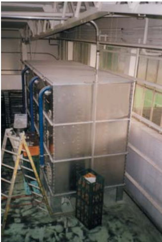
Mehlsilo mit Filtertuchabschluss