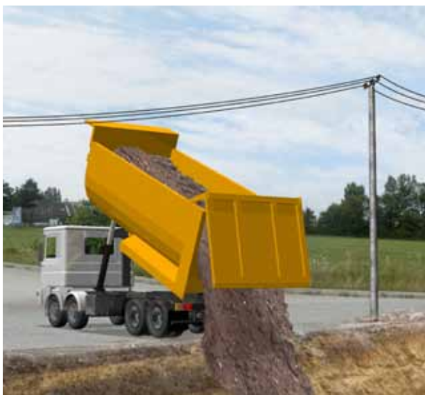
Gefährliche Arbeiten finden sich auf der Baustelle ...

Bauarbeitenkoordinationsgesetz (BauKG), BGBl. I Nr. 37/1999 Gesetzestext als Download: www.ris.bka.gv.at