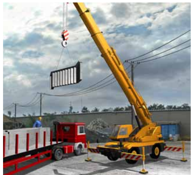
... in verschiedenen Ausprägungsformen