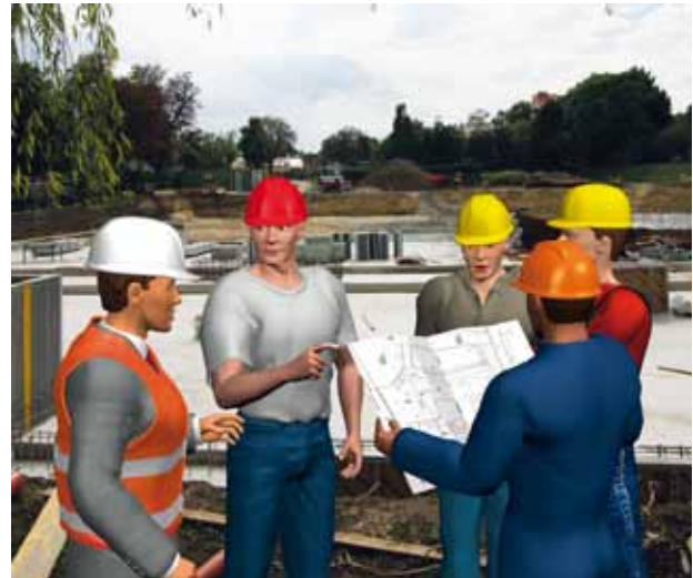
Die Koordinatoren haben eine Schlüsselposition

Gefährliche Arbeiten: Arbeiten, die mit besonderen Gefahren für Sicherheit und Gesundheit der Arbeitnehmer verbunden sind, insbesondere: Arbeiten, bei denen die Gefahr des Absturzes, des Verschüttet-